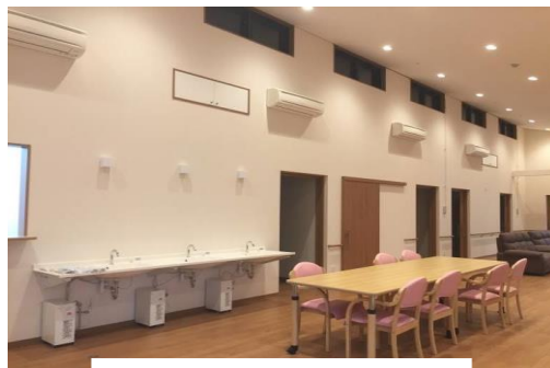
食堂兼リビングルーム